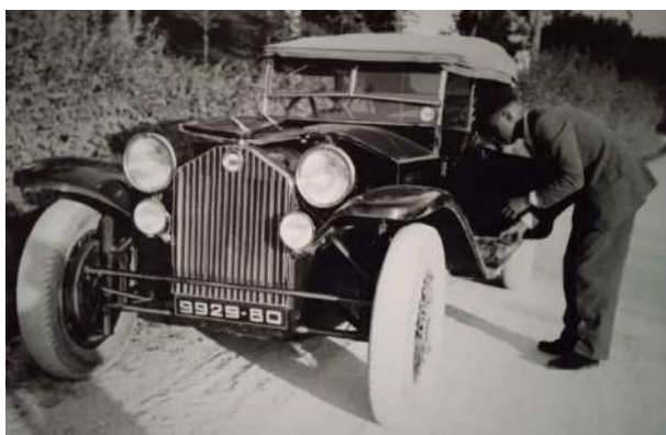
Lambda VII serie in panne.