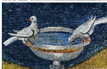
Ravenna, Basilica di San Vitale ed i suoi mosaici.