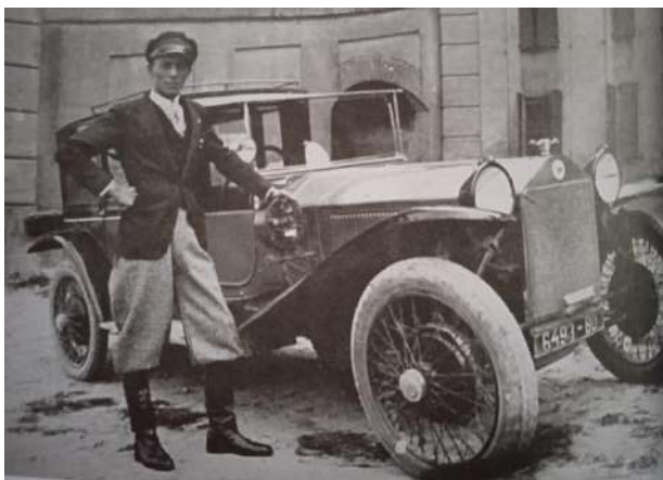
Tassista orgoglioso di una ormai vecchia seconda serie trasformata in taxi.