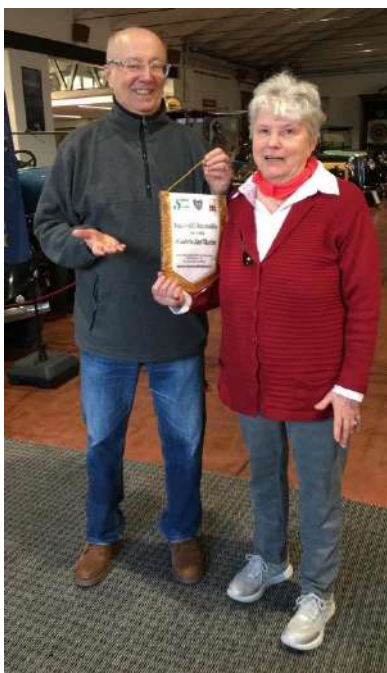
Consegna del Gagliardetto da Presidente a Presidente